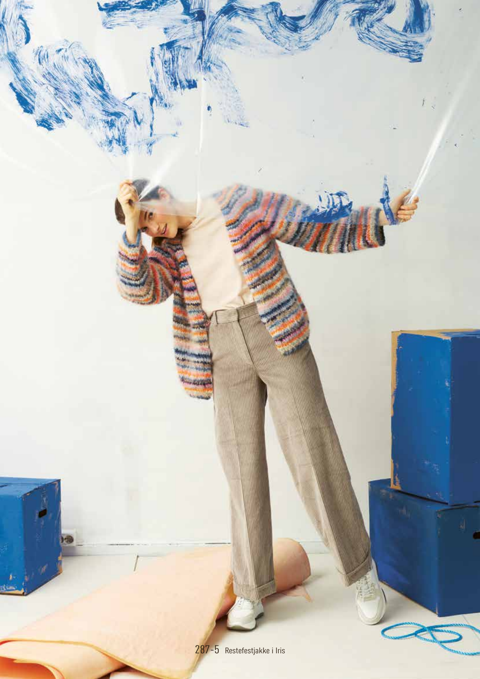
287-5 Restefestjakke i Iris