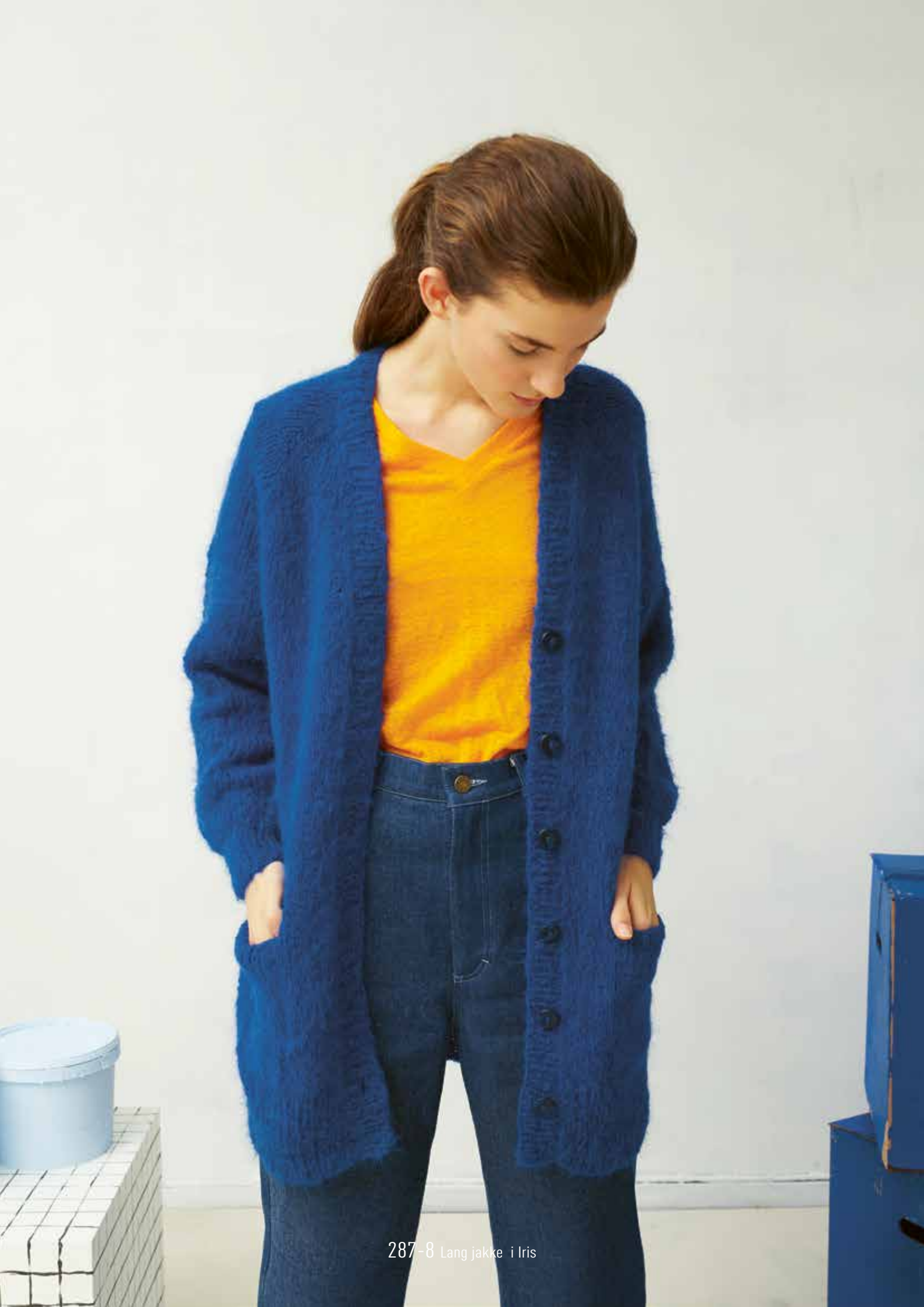
287-8 Lang jakke i Iris