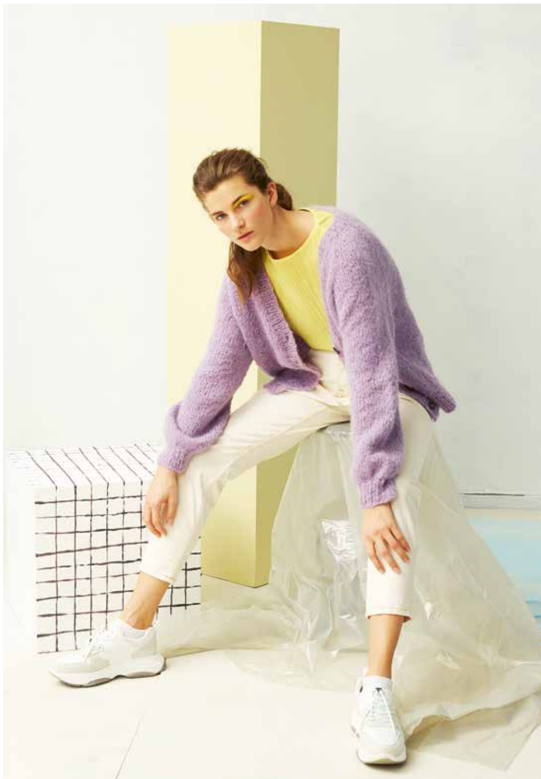
287-11 A Favorittjakke i Iris

Se forhandlerliste på www.raumagarn.no Del arbeidet ditt på Instagram #raumagarn