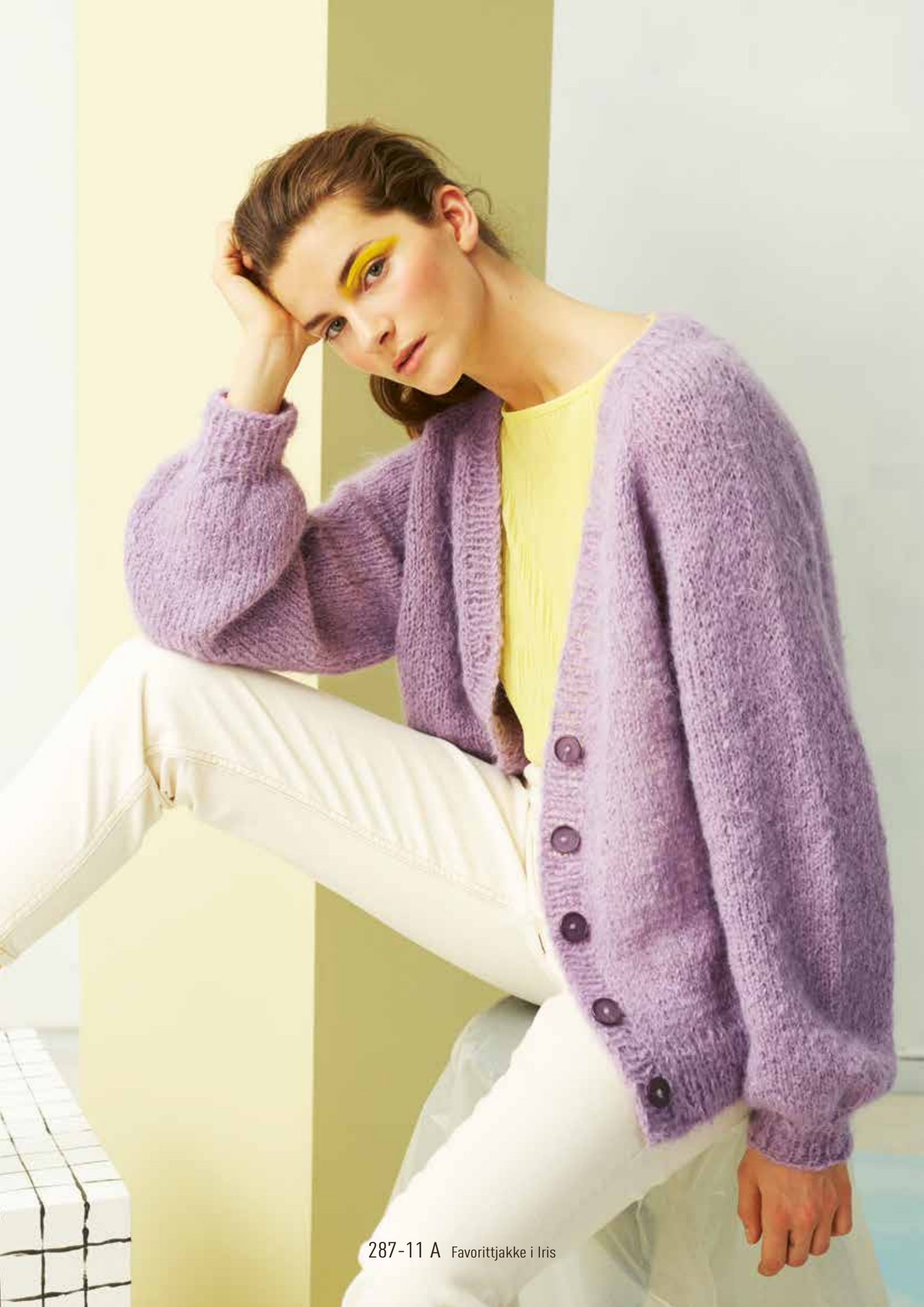
287-11 A Favorittjakke i Iris