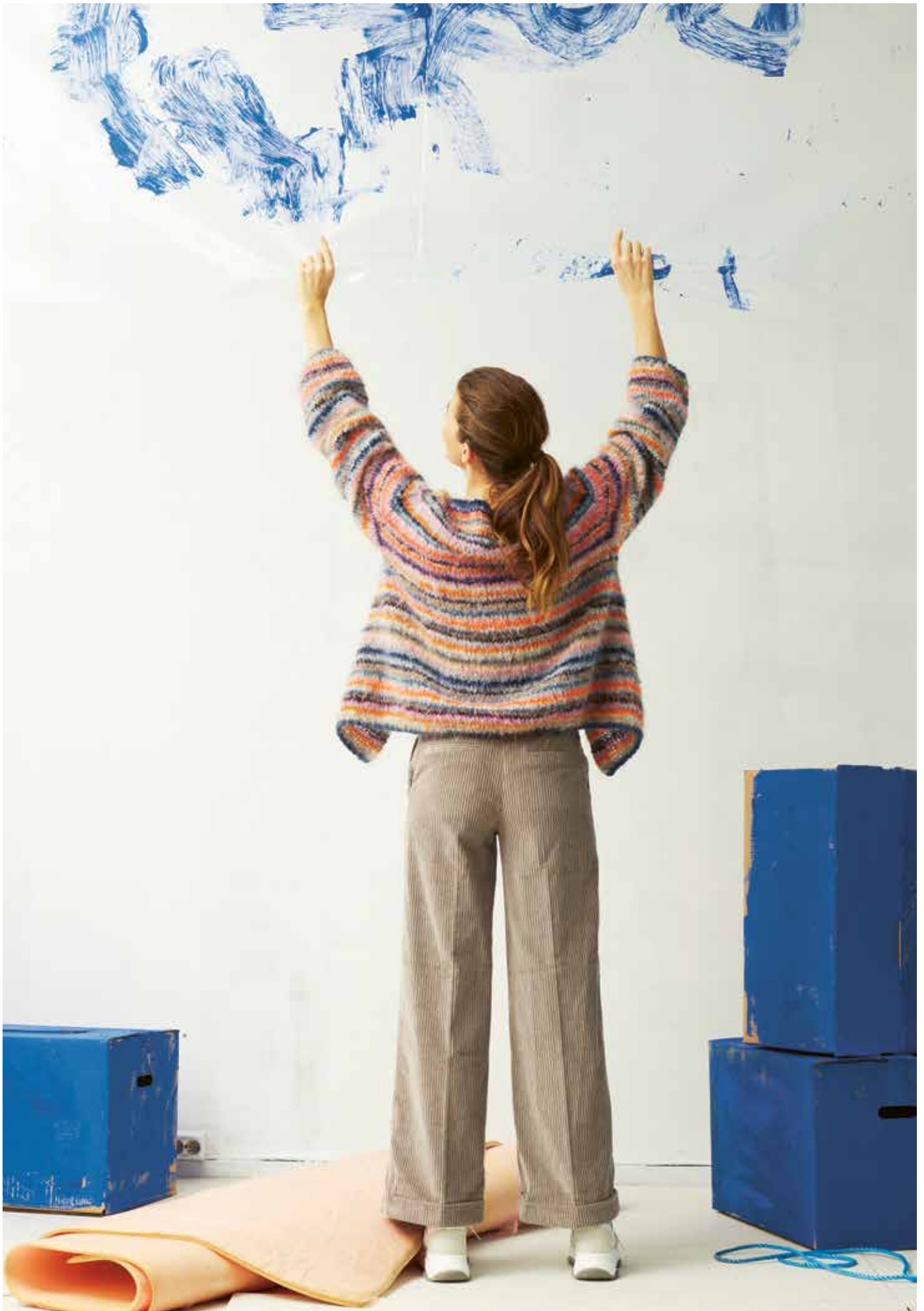
287-5 Restefestjake i Iris