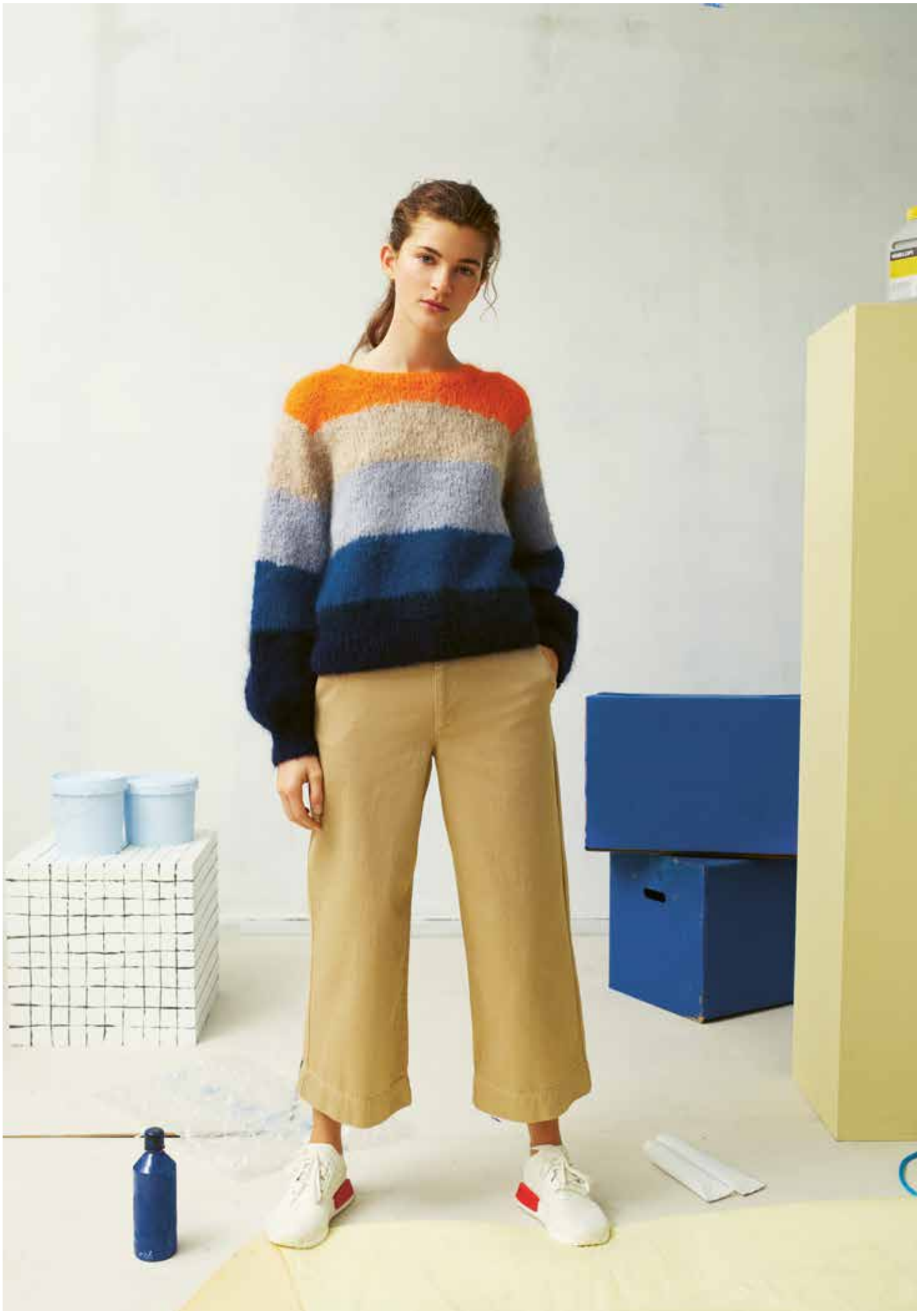
287-7 Natt og dag-genser i Iris