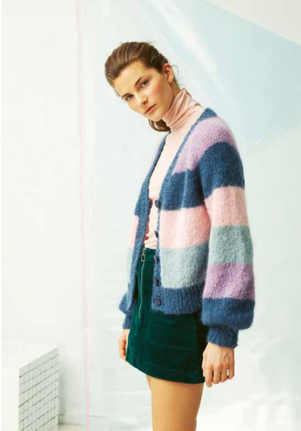
287-11 B Favorittjasje med striper i Iris