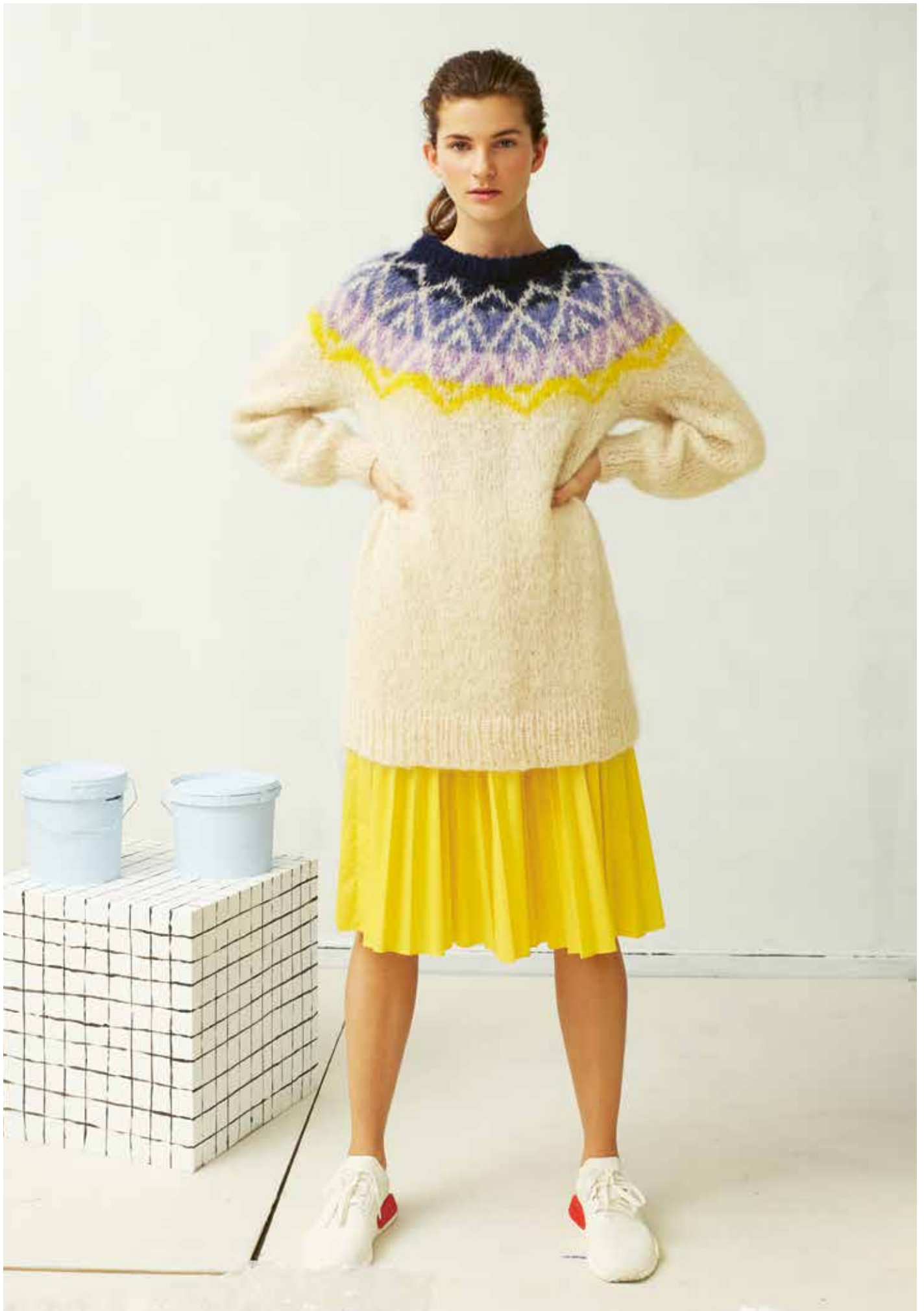
287-9 Dagdrømgenser i Iris