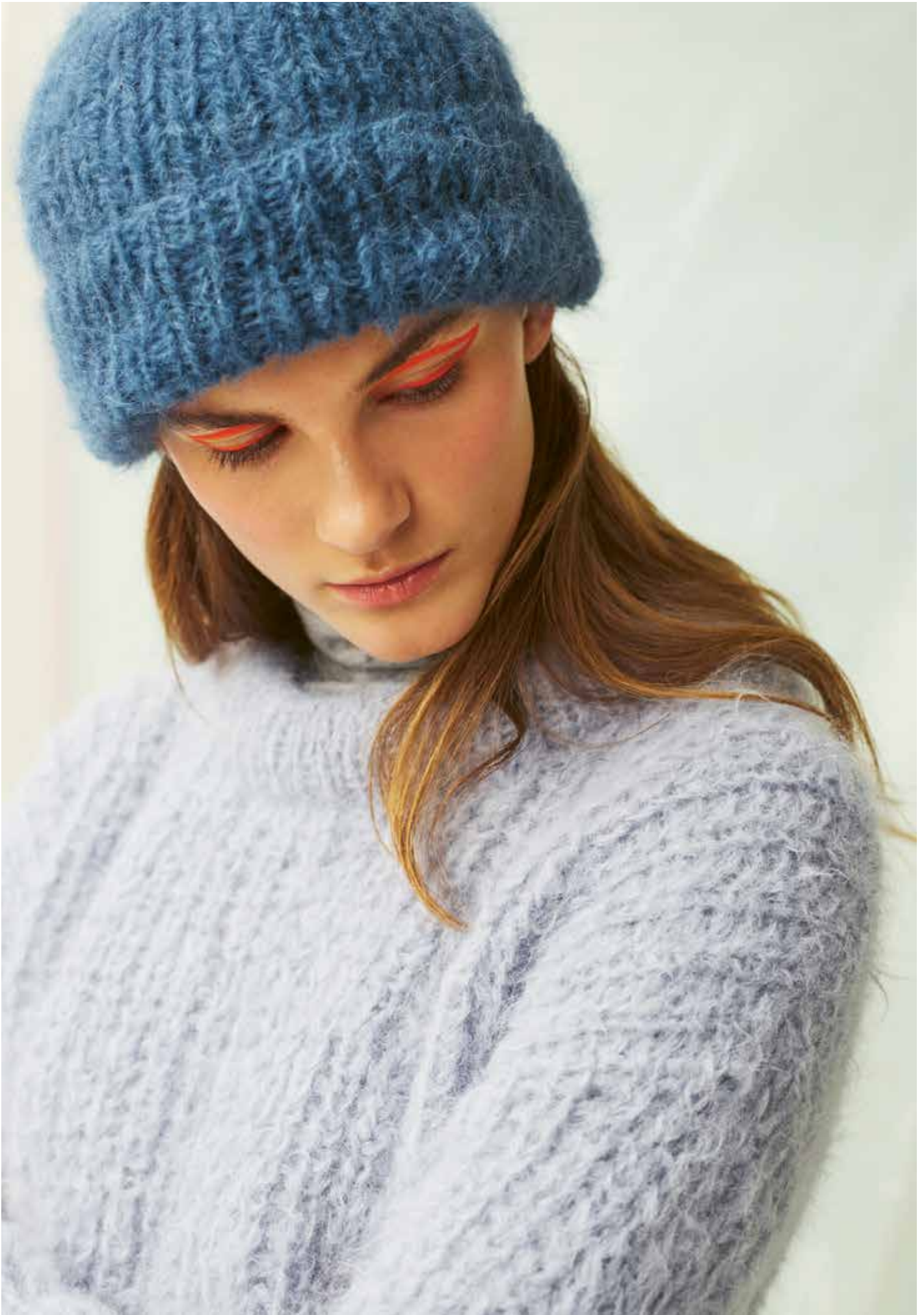
287-4 Lue i Iris