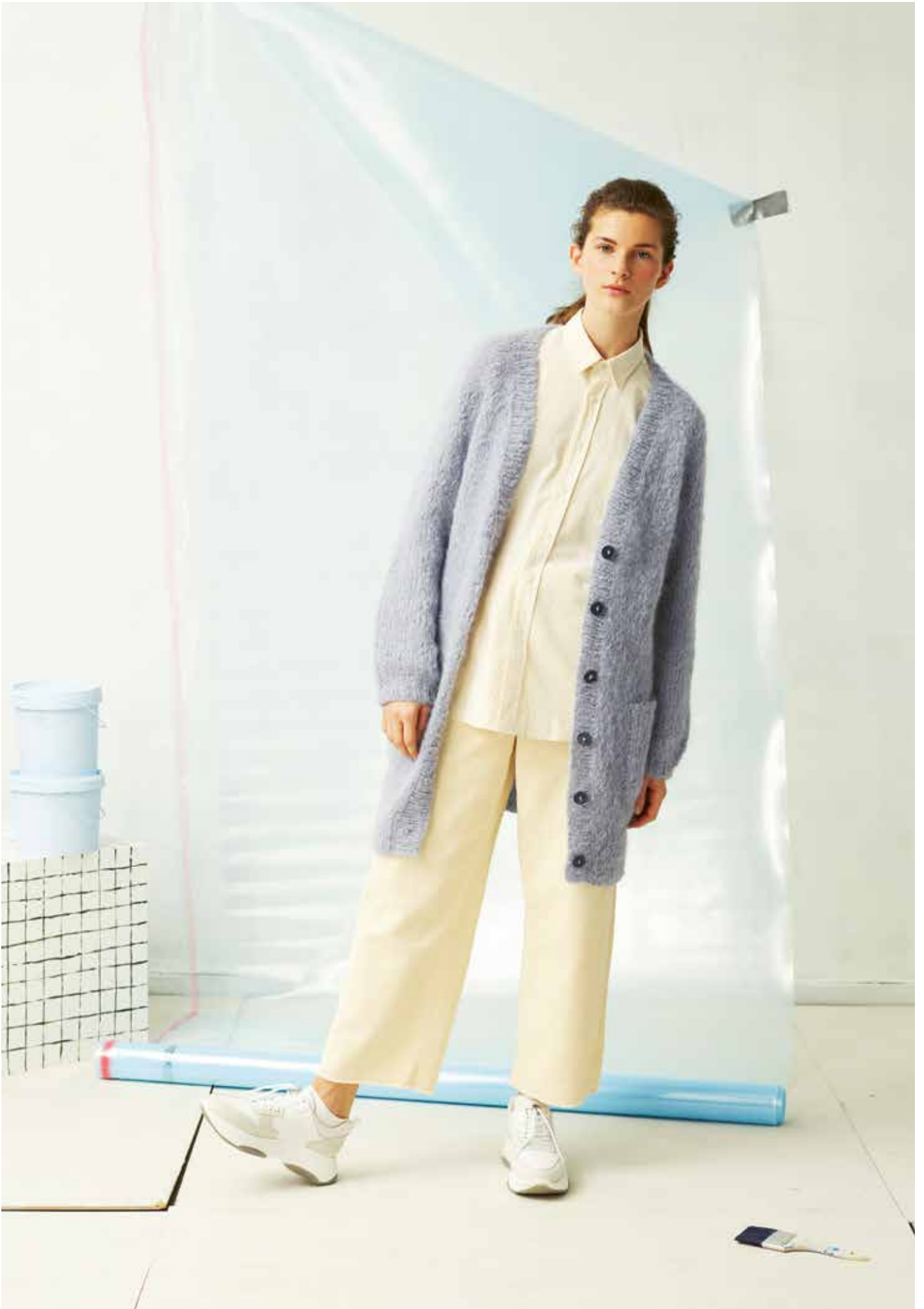
287-8 Lang jakke i Iris